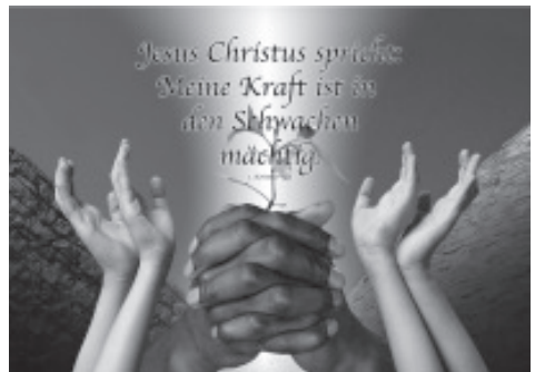
Illustration: Tabea Vahlenkamp; www.creatiphoto.de

system. Bewundernd sprechen wir von der Powerfrau und dem Mann, der Stärke bewiesen hat. Schwäche meinen wir uns nicht leisten zu können. Das Gefühl der Ohnmacht ist so schwer auszuhalten, dass wir es gern verdrängen oder überspielen - wir gestehen es weder uns noch anderen ein. Schwach kann ich mich bestenfalls da zeigen, wo ich mich geliebt weiß. Gottes Kraft aber, davon ist Paulus überzeugt, wird vor allem in der